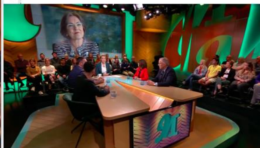
NPO: M talkshow met Margriet van der Linden 3-05-2019